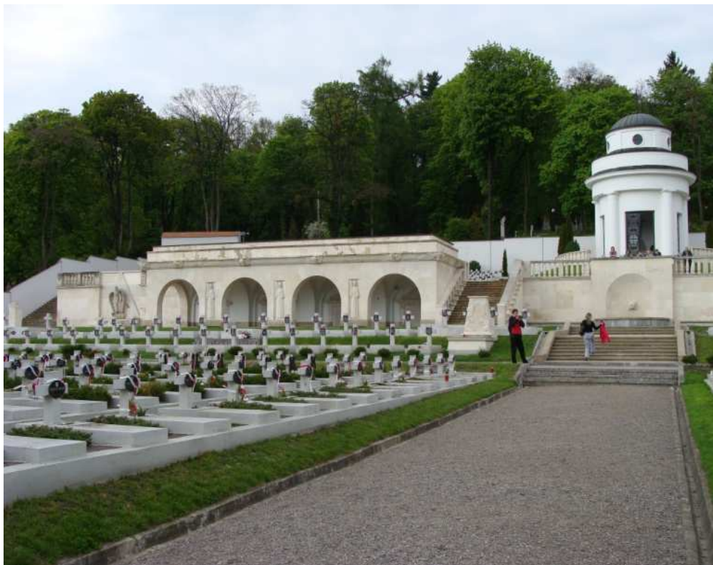
Fot. 2. Cmentarz Orłąt Lwowskich

Charakterystyczny dla niego jest pomnik Chwały wraz z kolumnadą, a także figuralne pomniki Lotników Amerykańskich oraz Piechurów Francuskich. Cmentarz ten uległ zniszczeniu podczas i po II wojnie światowej. Jego odbudowy dokonano dopiero po 1989 r. Po latach cmentarz został zrekonstruowany, lecz nadal trwały spory ze stroną ukraińską o napisy na tablicach i inne polskie akcenty. Kompromisowe porozumienie było możliwe dopiero po demokratycznych zmianach na Ukrainie, a oficjalne jego otwarcie nastąpiło 24 czerwca 2005 r. 14