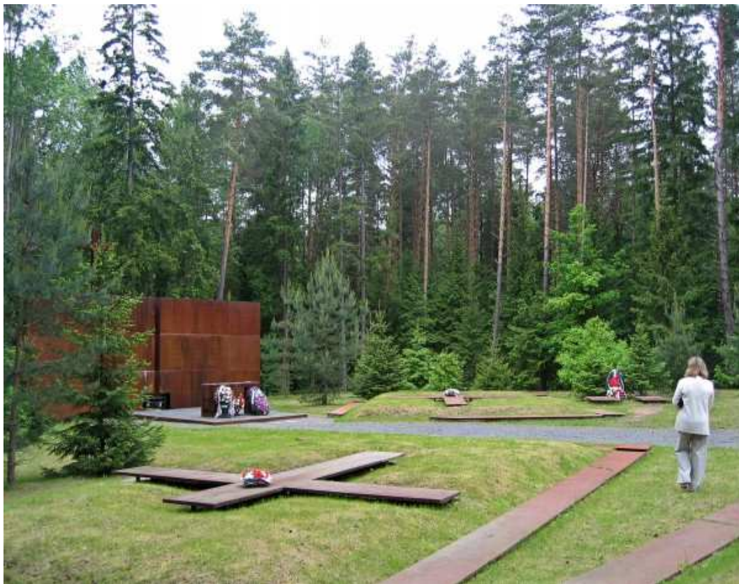
Fot. 1. Las Katyński